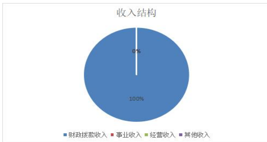
图 1. 收入决算图